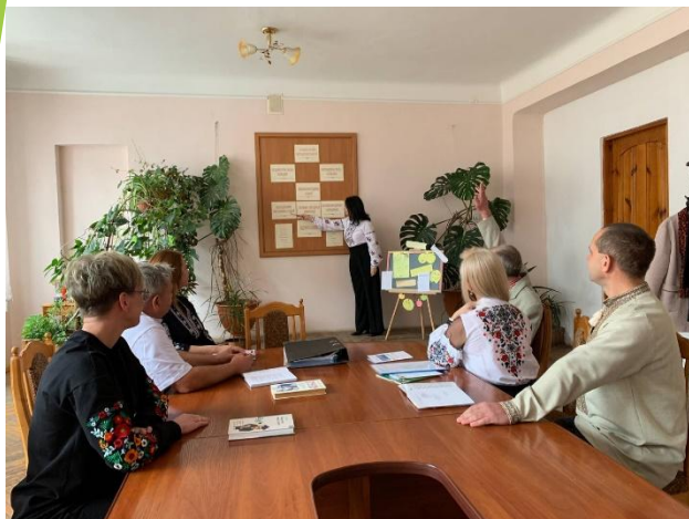
Тематика доповідей ЦК на 2022-23 н. р.